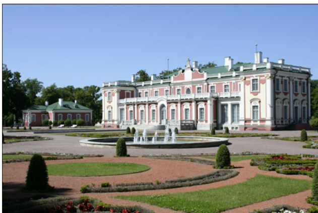
Obr 3. Palác umění Kadriorg v estonském Tallinnu

Pro splnění požadavku investora byl jako systém SCADA/HMI použit systém Reliance v konfiguraci server – klient. Na samostatném serveru probíhá veškerá komunikace a integrace všech napojených technických zařízení budovy. V objektu je nainstalováno 731 požárních