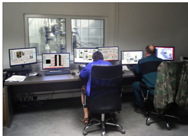
Obr. 2. Dispečink malé elektrárny na spalování biomasy

Od samého počátku požadoval investor, aby měření a regulace veškerých technických zařízení budovy byly integrovány do jednotného dispečerského pracoviště. Na tomto záměru se firma Buildsys s investorem podílela již od projektové fáze. Tak se podařilo přenést požadavky